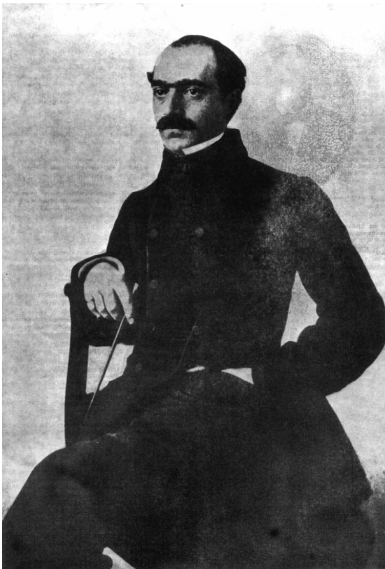
Vasile Alecsandri [1818 (1821?) -1890]